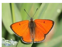
Le Cuivré des marais