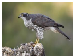
L'Autour des palombes