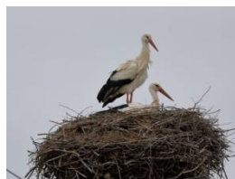
La Cigogne blanche