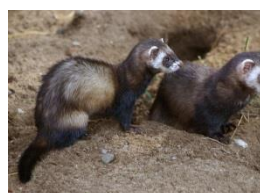
Le Putois d'Europe