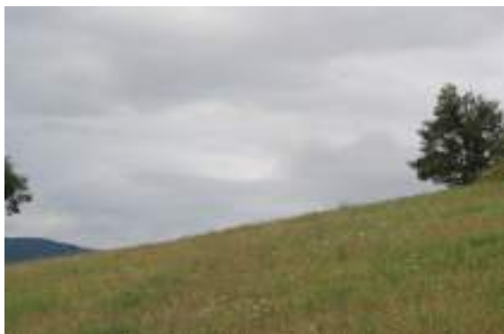
Prairie de fauche