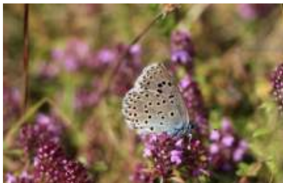
Azuré du serpolet ( Phengaris arion )