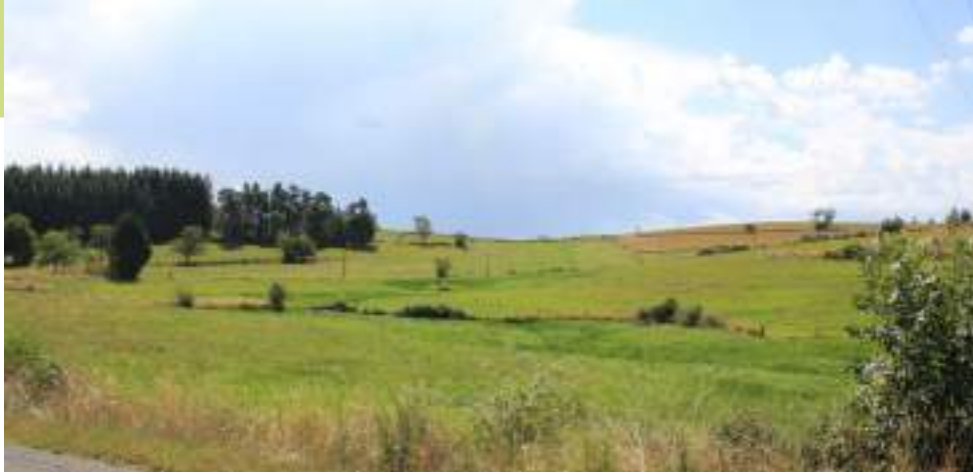
Prairies humides, à proximité de la Bruyère à Aboën

Les prairies naturelles de fauche, dont certaines montrent un faciès humide, sur la commune d'Aboën présentent un enjeu important. Ce milieu en lui-même présente un intérêt mais il abrite également des espèces comme des orchidées, des oiseaux (Alouette lulu et Bruant jaune par exemple) ou l'Azuré du serpolet (un papillon) qui sont protégées et en voie de disparition. Les prairies naturelles sont en régression car elles sont menacées par l'intensification des pratiques agricoles (sursemis, retournement, apport d'engrais). Des prairies à Azuré du serpolet sont encore présentes autour de Montcoudiol. La mosaïque que forme ces prairies avec les boisements est également importante dans la fonctionnalité écologique en permettant à une grande diversité d'espèces d'accomplir leur cycle de vie.