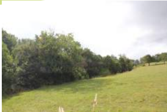
Frênaie-Chênaie et prairie sèche

Au nord de la commune de Chagnon, la vallée de la Durèze est composée majoritairement de boisements, de fourrés et d'espaces ouverts agricoles. Parmi ces boisements, la frênaie-chênaie est un type de boisement remarquable. On y trouve aussi bien des chiroptères (petit rhinolophe, barbastelle d'Europe) que des oiseaux forestiers. Quatre espèces de pics sont connus sur la commune. La mosaïque que forment ces boisements avec les prairies est importante dans la fonctionnalité écologique en permettant à une grande diversité d'espèces d'accomplir leur cycle de vie. Sur les prairies sèches de Chagnon, autour de Cruziot, est connu un papillon rare, l'azuré des orpins. Pour accomplir son cycle de vie, ce papillon a besoin de sa plante-hôte mais aussi d'une espèce de fourmi particulière qui va s'occuper de la nymphe au sein de la fourmilière avant sa transformation. La gestion extensive des milieux permet de les préserver durablement pour la biodiversité mais aussi pour les services rendus à l'espèce humaine : lutte contre le réchauffement climatique, stockage de carbone, apport de ressources énergétiques, etc.