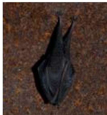
Le petit rhinolophe ( Rhinolophus hipposideros )