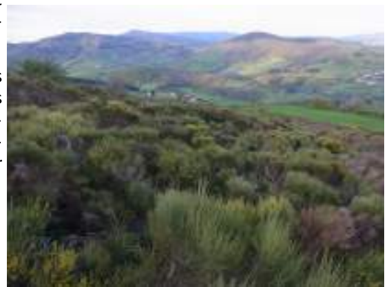
Lande au sud de la commune

Les prairies de fauche constituent également des habitats riches en flore et favorables à la faune associée aux milieux agricoles tant que les pratiques ne s'y intensifient pas. Entourées de boisements, elles forment une mosaïque dont la fonctionnalité écologique permet à une grande diversité d'espèces d'accomplir leur cycle de vie.