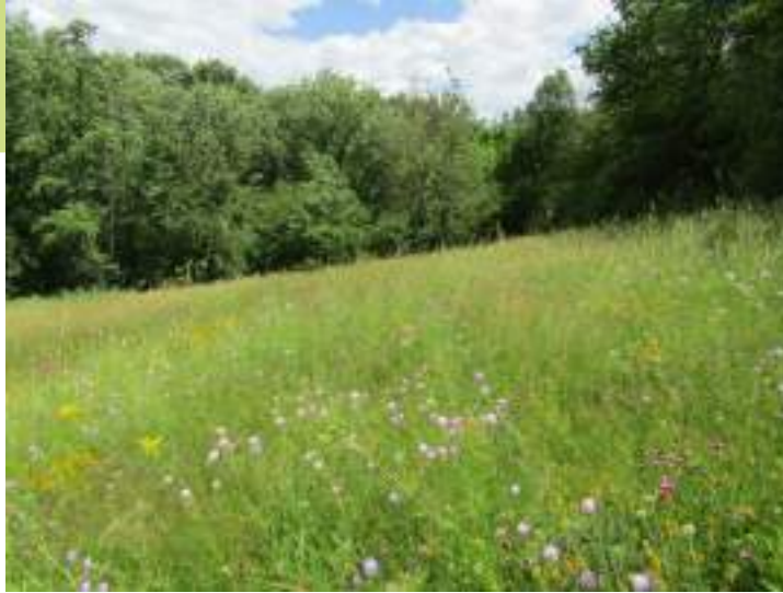
Prairie de fauche avec une flore diversifiée

Au niveau du ruisseau de la Gimond, entre Roissieux et la Blétaille par exemple, différents types de prairies de fauche sont observés. Elles constituent des habitats riches en flore et favorables aux espèces associées aux milieux agricoles tant que les pratiques ne s'y intensifient pas. Entourées de boisements, elles forment une mosaïque dont la fonctionnalité écologique permet à une grande diversité d'espèces d'accomplir leur cycle de vie comme le tarier pâtre et le bruant jaune pour les oiseaux. Les boisements de la commune, et notamment le "Grand bois", au sud-ouest, représentent également des habitats à enjeux pour le territoire.