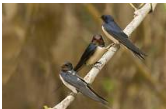
L'hirondelle rustique ( Hirundo rustica )