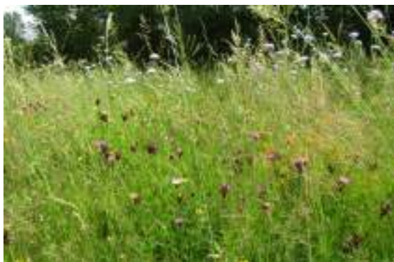
Prairie de fauche