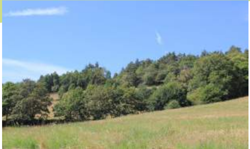
Boisement et prairie de fauche à Fraisses (le Pin)

Les boisements de feuillus situés sur la marge sud-ouest de la commune sont relativement préservés tout comme l'ensemble des prairies naturelles situées sur les pentes environnantes. Dans ce secteur, les vallons boisés très pentus et orientés vers le nord entre Coire et l'Oye recèlent quelques beaux hêtres et des espèces remarquables telles que le pic noir ou encore la barbastelle d'Europe (chauve-souris fréquentant lisières et boisements) sont bien présentes.