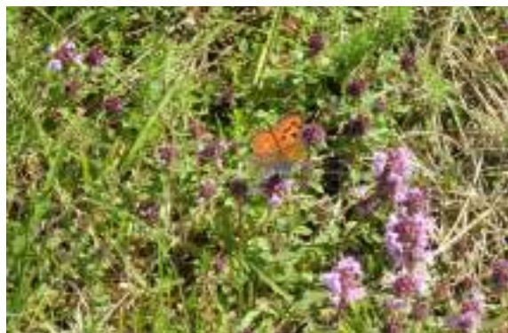
Le cuivré mauvin ( Lycaena alciphron )