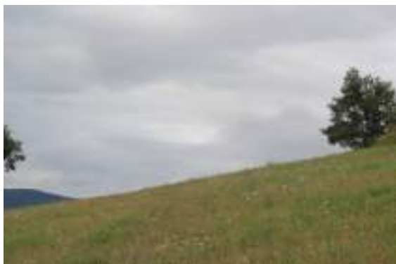
Prairie de fauche