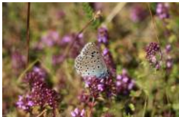
L'azuré du serpolet ( Phengaris arion )