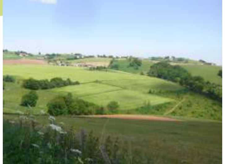
Paysage agricole des monts du Lyonnais

De petits boisements de feuillus sont également présents ici et là sur les versants dominant les cours d'eau du territoire.