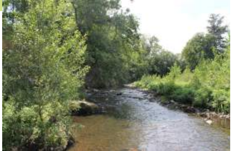
Le Gier et sa ripisylve

Le Gier et sa ripisylve, bien que largement colonisée par les espèces exotiques envahissantes, reste un corridor de déplacement et un habitat pour de nombreuses espèces aquatiques.