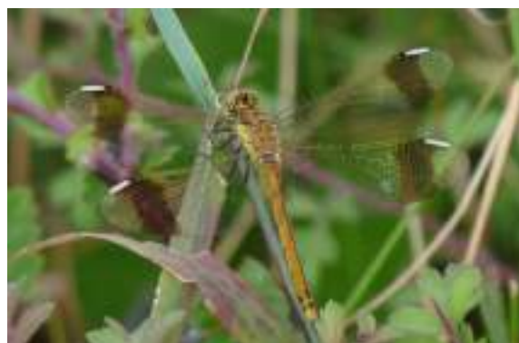
Le sympétrum du Piémont