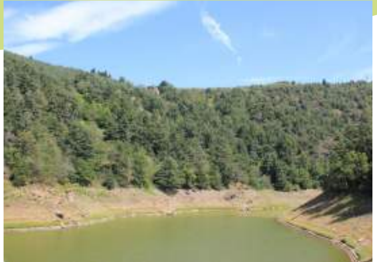
Vue de la vallée de l'Ondenon depuis le barrage

Des ensembles de prairies naturelles sont toujours présents sur le versant nord du Pilat près de la Chavanna tout comme sur le rebord sud du plateau du Bessy, au dessus de la Rivoire.