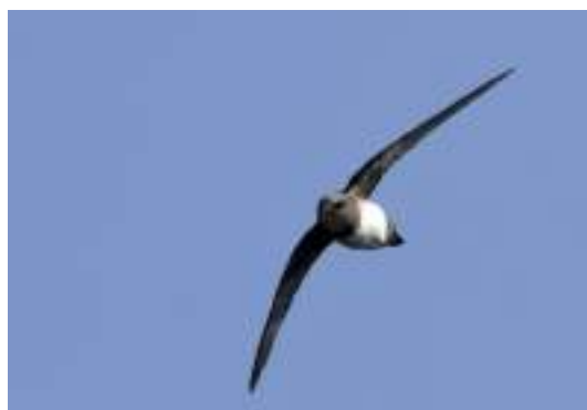
Le martinet à ventre blanc ( Tachymarptis melba )