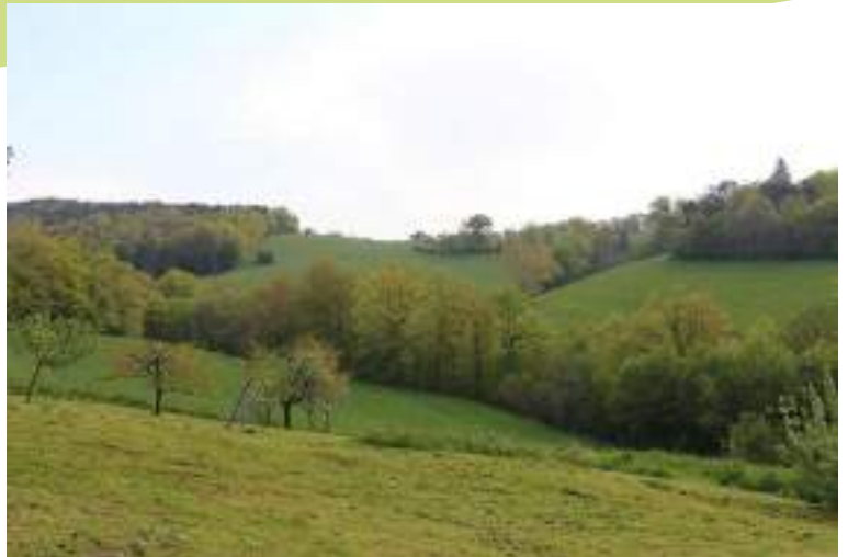
Vue sur le bocage du vallon de Fontvieille

Le vallon entre Fontvieille et Pont Bayard forme un ensemble bocager assez préservé avec des prairies naturelles, de nombreux bosquets, des haies et des mares.