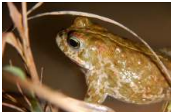
Le crapaud calamite ( Epidalea calamita )