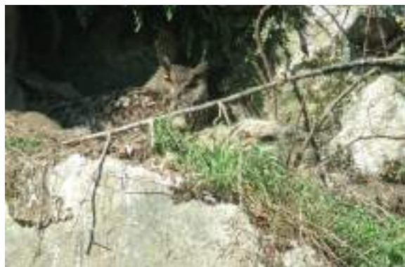
Le grand-duc d'Europe ( Bubo bubo )