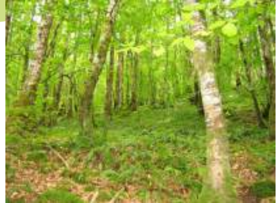
Sous-bois en hêtraie

Les boisements de feuillus et les affleurements rocheux de la vallée de la Mornante sont également remarquables.