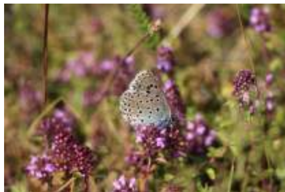
L'azuré du serpolet ( Phengaris arion )