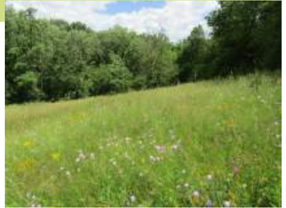
Prairie de fauche gérée de façon extensive

Malgré sa proximité avec l'agglomération stéphanoise, la commune possède encore une majorité de surfaces agricoles. Parmi ces dernières, les secteurs du Crêt de la Bardonnanche et de Peymartin sont dominés par les prairies naturelles et si le maillage de haies s'est difficilement maintenu, les vallons restent relativement boisés, constituant un réservoir de biodiversité sur la commune et permettant à la faune de se déplacer.