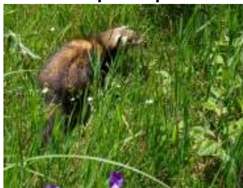
Le putois d'Europe ( Mustela putorius )