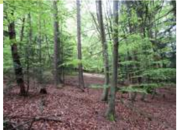
Sous-bois en hêtraie

Les versants nord du Pilat, et notamment les vallons les plus frais, sont parfois constitués de hêtraie alors que la sapinière reste le peuplement dominant à l'étage montagnard.