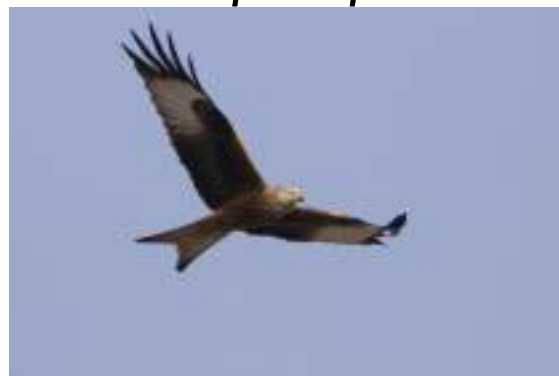
Le milan royal ( Milvus milvus )