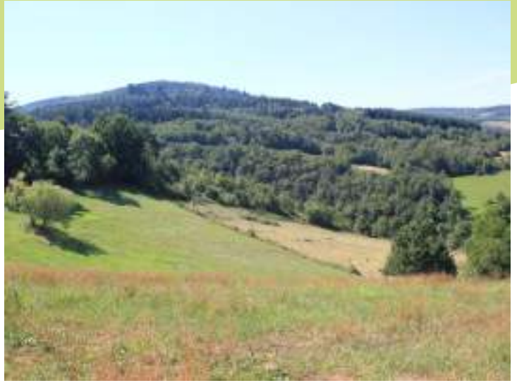
Prairies et boisements au Chambon-Feugerolles

Les versants nord du Pilat sont entaillés de vallées encaissées principalement occupées par des boisements de feuillus. Ainsi, les vallées du Mallevall et de la Valchérie présentent quelques belles hêtraies dans les zones les plus fraîches. Le bois de la Montat, plus thermophile, est situé sur une crête dominant la Valchérie. Il est constitué d'un peuplement de chênes et de pins et on y observe des affleurements rocheux.