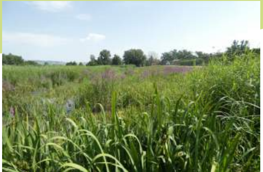
Bassin de phyto- épuration à Lorette

Par ailleurs, les bassins artificiels de baignade et de phytoépuration abritent la reproduction de libellules rares et menacées, les symétrums du piémont et déprimé. Une gestion adaptée de ses bassins permettra de pérenniser ces populations d'espèces patrimoniales.