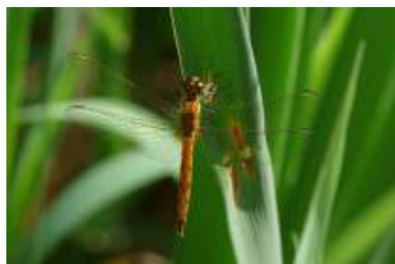
Le sympétrum déprimé ( Sympetrum depressiusculum )