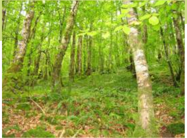
Sous-bois d'une hêtraie

Par ailleurs, sur la partie sud-ouest de la commune, plusieurs secteurs de prairies naturelles en contexte bocager sont également identifiés entre Grange Rouet, le Petit Valluy, Salvigneux et le bourg.