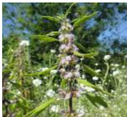
L'agripaume cardiaque ( Leonurus cardiaca )