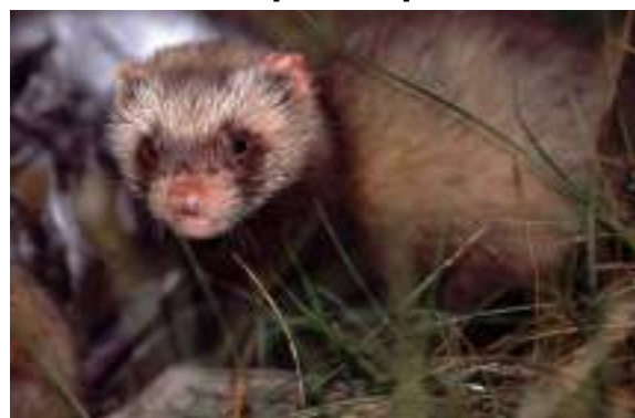
Le Putois d'Europe ( Mustela putorius )