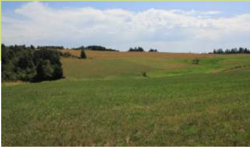
Zone de prairies humides à Rozier-Côtes-d'Aurec

Les prairies naturelles du secteur de Martinange abritent de nombreuses espèces spécialistes des milieux agricoles telles que les alouettes des champs et lulu ou le bruant jaune. Des milieux équivalents dont certaines prairies humides, sont également présents entre Guéret Blanc et Garnaudet bien que des cultures soient aussi implantées dans le secteur.