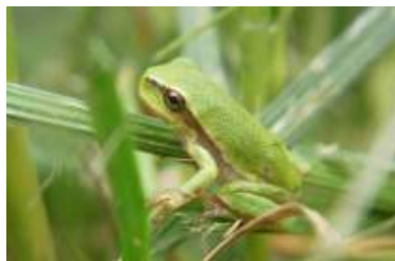
La rainette verte ( Hyla arborea )