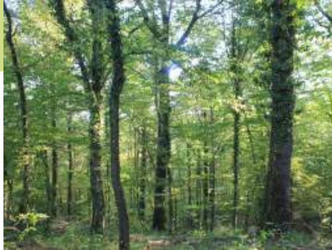
Sous-bois de la forêt des Varennes à Saint-Bonnet-les-Oules

L'ensemble des boisements, majoritairement de feuillus, situés au sud de la commune sont plutôt intéressants car ils abritent de nombreuses espèces patrimoniales (murin de Bechstein, pic mar, etc.) et qu'ils s'inscrivent dans un contexte forestier plus large jouant également un rôle dans les déplacements de la faune. Ainsi, les portions des bois du Roy et de Monichard situés le territoire sont des habitats remarquables à préserver.