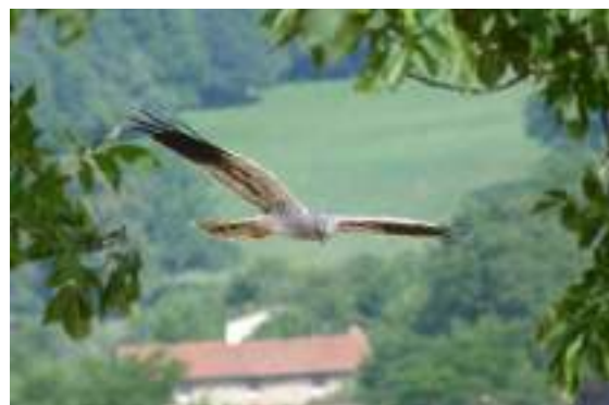
Le busard cendré ( Circus pygargus )