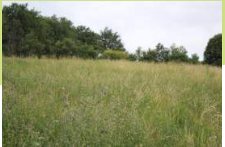
Prairie naturelle de fauche (E2.2)

La commune de Saint-Christo-en-Jarez est majoritairement composée de milieux agricoles dont les pratiques sont relativement intensives, avec des prairies temporaires et une forte rotation des cultures. Toutefois, le secteur de Manis-sol, situé au nord du bourg, est constitué d'un bel ensemble de prairies naturelles de fauche et il est bordé de quelques boisements de feuillus (bois de la Cure et bois de Narfait) qui surplombent les sources du Couzon. La présence d'un joli vallon humide pâturé et encore très bocager, à l'ouest du lieu-dit "La Bessia", permet d'accueillir de nombreuses espèces peu présentes sur le reste de la commune, notamment en invertébrés.