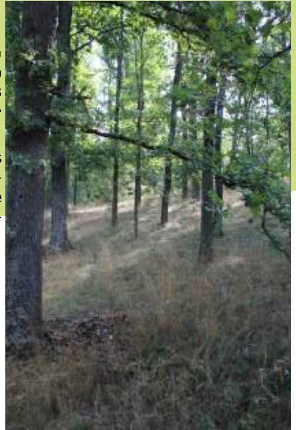
Frênaie-chênaie située à Saint-Galmier, dans le secteur de Rochepont

Les boisements thermophiles et les pelouses sèches des coteaux dominant la vallée de la Coise sont également très intéressants tout comme les ensembles de prairies naturelles situées entre l'aérodrome et la Viallary.