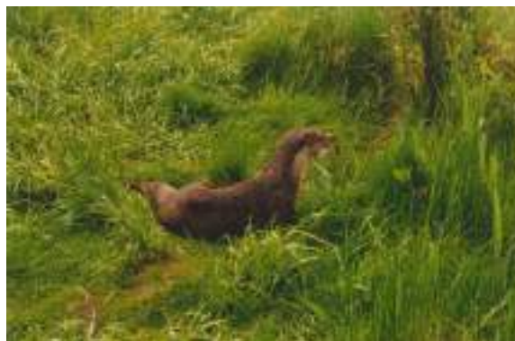
La loutre d'Europe ( Lutra lutra )