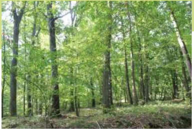
Boisement de feuillus remarquable sur le secteur de La Robertanne à Saint-Genest-Lerpt

Le vallon du ruisseau de Grangent constitue un ensemble boisé relativement préservé avec des peuplements de feuillus (chênes principalement) et mixtes. D'autres bois sont également présents sur la communes et jouent un rôle fonctionnel pour les espèces forestières.