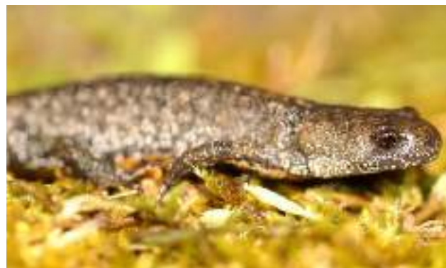
Le Triton Crêté ( Triturus cristatus )