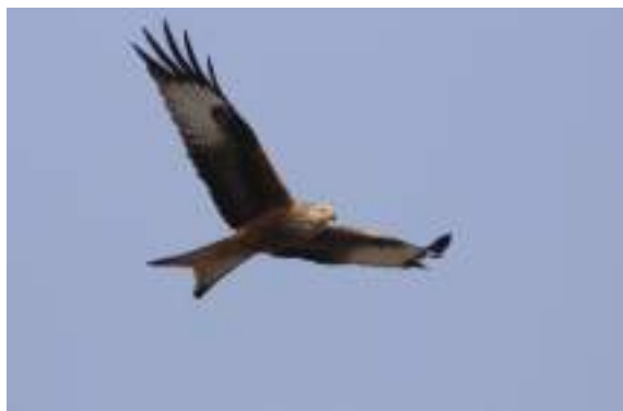
Le milan royal ( Milvus milvus )