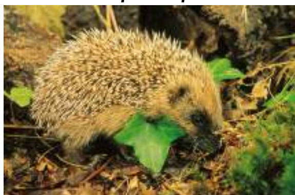
Le hérisson d'Europe ( Erinaceus europaeus )