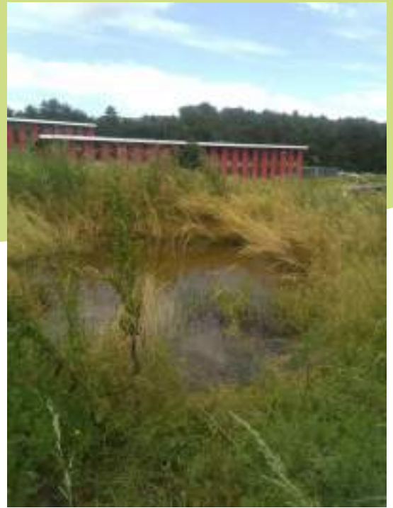
Mare créée en 2022 sur le site de Métrotech

Les reliefs présents sur une majeure partie de la commune ont permis de limiter l'urbanisation à la partie sud-est de son territoire, qui est voisin de Saint-Etienne. Parmi les secteurs naturels présents sur la commune, les environs du parc technologique de Métrotech sont plutôt préservés, notamment les boisements de feuillus ou mixtes situés sur le Crêt Beauplomb et les vallons situés plus à l'est. Le maillage bocager est également dans un état tout à fait correct avec un réseau de haies, de bosquets et des mares bien présents. Ce secteur est classé en « Corridor écologique » d'enjeu régional. Il fait le lien entre les monts du Pilat et ceux du Lyonnais (actuellement dysfonctionnel au niveau de l'autoroute).