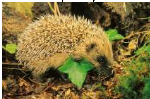
Le hérisson d'Europe ( Erinaceus europaeus )