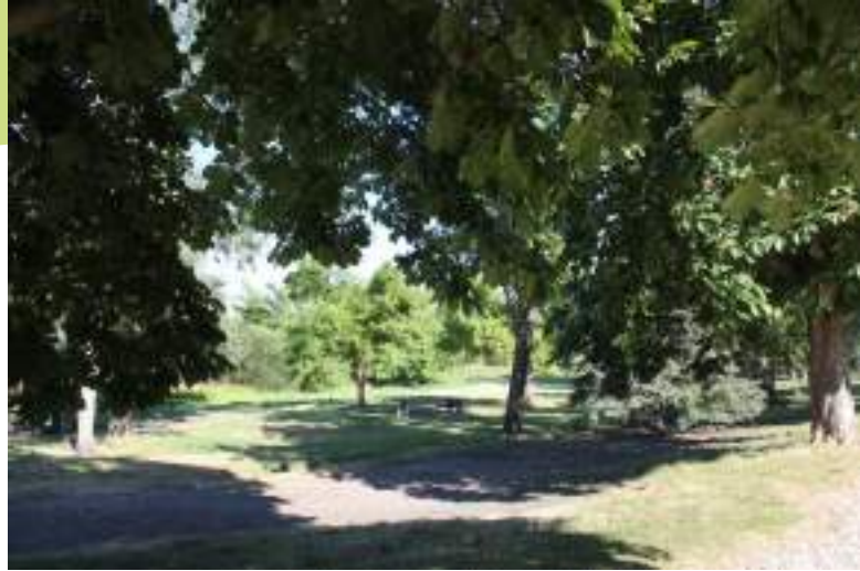
Espace vert arboré du parc Jean Marc à Saint-Priest-en-Jarez

Saint-Priest-en-Jarez est une commune presque entièrement urbanisée et les rares espaces verts sont souvent les ultimes refuges pour la faune et la flore sauvages sur ce territoire. Ainsi le Parc Jean Marc, au même titre que le Crêt, le Clos Bayard ou de la zone de la Doa accueillent un certain nombre d'espèces qui y accomplissent leur cycle. Ces îlots constituent également des points de passage privilégiés par les espèces lors de leurs déplacements. Ces espaces verts jouent alors un rôle fonctionnel primordial dans cette commune.