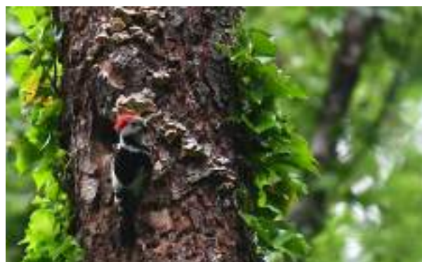
Le pic mar ( Leipicus medius )