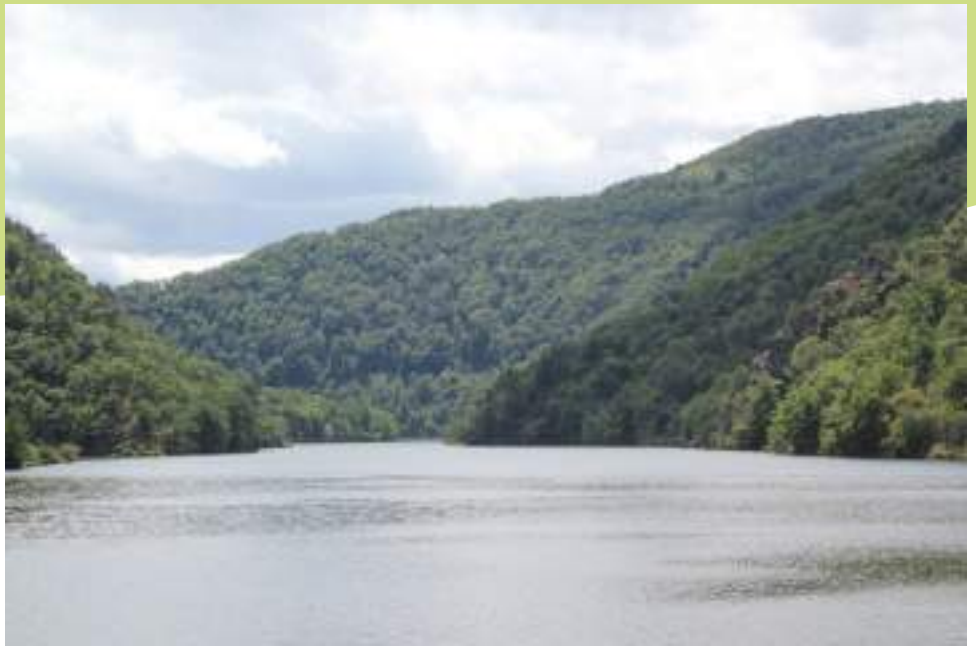
Les gorges de la Loire à Saint-Victor

En dehors de la réserve, plusieurs milieux sont également très intéressants pour la biodiversité. Peut être cité le complexe de pelouses sèches dominant la vallée du Grangent vers Chénieux qui recèle des enjeux pour l'avifaune et les insectes des prairies. Il y a également les secteurs bocagers dominant les gorges et la vallée de l'Egotay vers Bécizieux et Trémas.