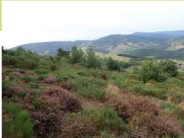
Lande à callune des Marandonnières

A l'autre extrémité de la commune, le massif boisé de la Grande Combe compte quelques petits peuplements de hêtres, boisement original sur ces versants.