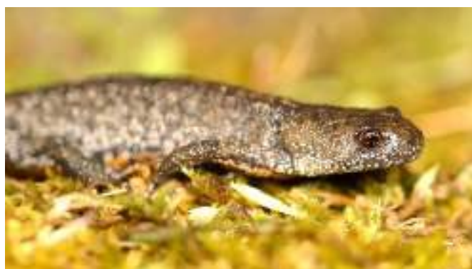
Le Triton crêté ( Triturus cristatus )