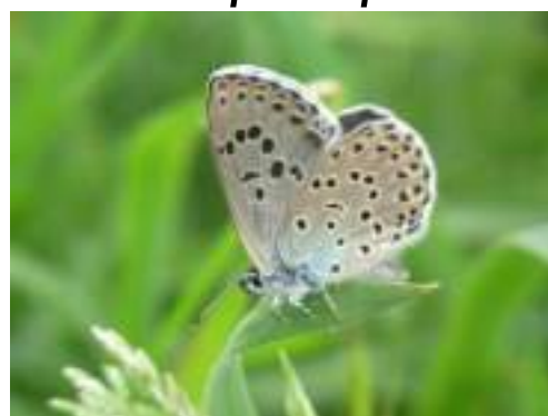
L'azuré du serpolet ( Phengaris arion )