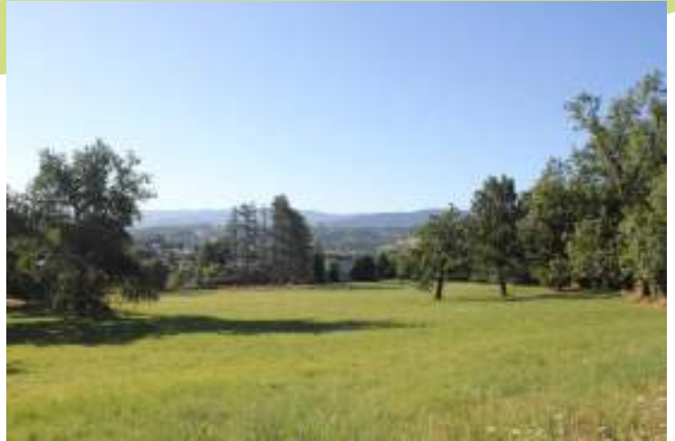
Prairie naturelle avec des arbres épars à Sorbiers

Commune périurbaine en limite de l'agglomération stéphanoise, Sorbiers présente tout de même de nombreux secteurs agricoles et naturels, là où le relief est plus marqué. Parmi ces secteurs, les vallons agricoles et forestiers situés à l'ouest de la commune, entre Montgirard et la Fortunière, sont constitués de prairies et de forêts de feuillus accueillant de nombreuses espèces à enjeux. La barbastelle d'Europe, la bondrée apivore et le gobemouche gris peuvent être cités pour les espèces forestières et la chevêche d'Athéna, le tarier pâtre pour les espèces spécialistes des milieux agricoles.