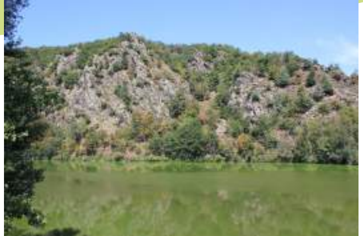
Zone rocheuse des gorges de la Loire au niveau d'Unieux

La présence des gorges de la Loire à l'ouest de la commune, dont la majeure partie est classée en Réserve Naturelle Régionale, a permis à des habitats riches de se développer. Ainsi, des boisements de pente sont présents ainsi que des pelouses sèches et autres végétations rases typiques des zones rocheuses où l'on retrouve notamment l'asarine couchée, l'engoulevent d'Europe, le grand-duc d'Europe, le milan noir et l'alouette lulu. Malgré une urbanisation relativement importante de la commune, certaines zones de prairies naturelles sont encore présentes sur la colline située au nord, au niveau des lieux-dits la Ronzière et Lardier et au niveau du vallon de la Triollière. D'autres secteurs agricoles enclavés par des habitations sont également à préserver au centre de la commune.