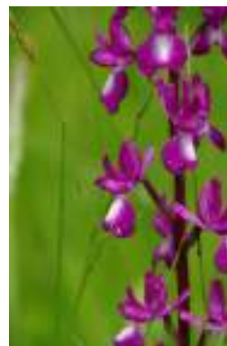
L'orchis à fleurs lâches (Anacamptis laxiflora)