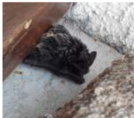
La barbastelle d'Europe ( Barbastella barbastellus )