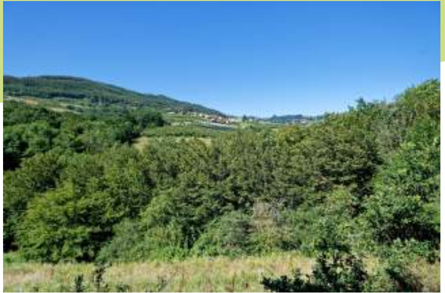
Boisements à Valfleury

La commune de Valfleury est marquée par un relief prononcé sur l'ensemble de son territoire. Les zones agricoles sont majoritaires sur la commune avec des prairies mais aussi des parcelles en arboriculture. Les secteurs boisés situés sur les hauts de pente à l'ouest de la commune sont constitués de feuillus, et notamment de hêtres au niveau du lieu-dit du Bois du Gas. Ce sont des habitats à enjeux sur la commune. Des espèces forestières à enjeux fréquentent ces boisements : blaireau, chirop- tères, écureuil roux, busard Saint-Martin, pic noir et gobemouche gris.