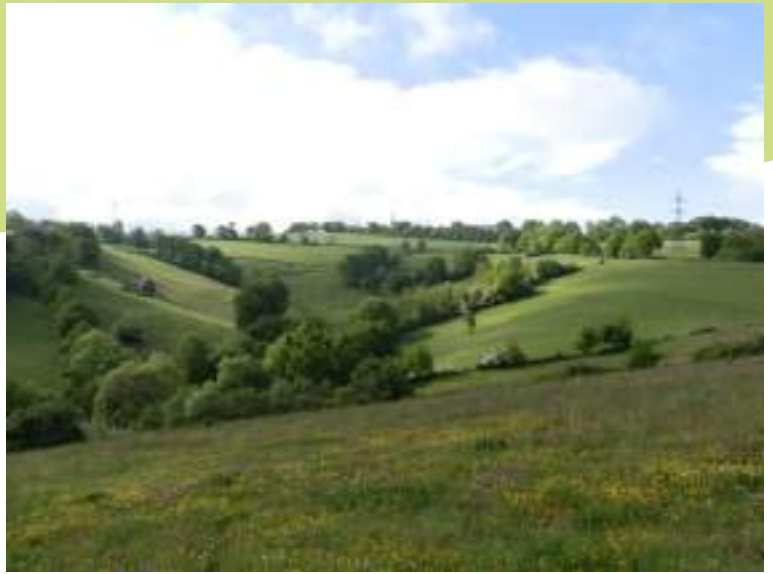
Vallon du Martourey

La majeure partie de la commune de Villars est urbanisée en lien avec sa proximité avec la ville de Saint-Etienne. Toutefois, plusieurs secteurs agricoles existent au nord et à l'ouest du territoire. Parmi ces secteurs peut être cité le vallon entre le Martourey et Rochefoy où une mosaïque d'habitats intéressants est présente. Ainsi, nous y retrouvons des prairies de fauche, des pâturages et des friches avec la présence de haies constituant des habitats riches en flore et favorables aux espèces associées aux milieux agricoles tant que les pratiques ne s'y intensifient pas. Les espèces patrimoniales connues dans ce secteur sont, par exemple, le crapaud calamite, la pie-grièche écorcheur, le tarier pâtre et la tourterelle des bois.