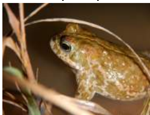
Le crapaud calamite ( Epidalea calamita )