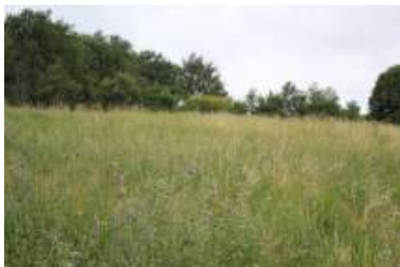
Prairie de fauche