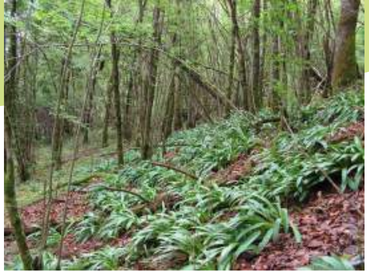
Sous-bois dans une hêtraie

La vallée du Reteux présente également des boisements de pente avec une mosaïque de prairies naturelles dans un contexte bocager assez préservé.