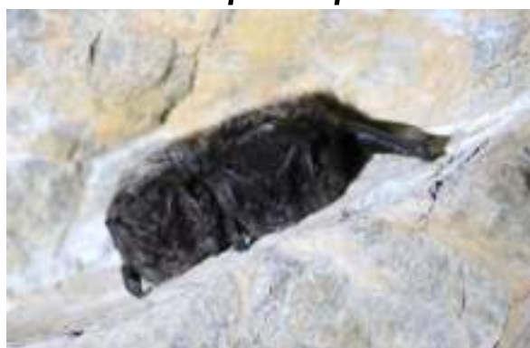
La barbastelle d'Europe ( Barbastella barbastellus )